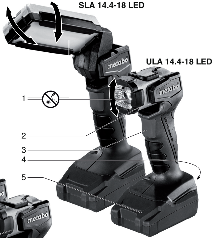
ULA 14.4-18 LED