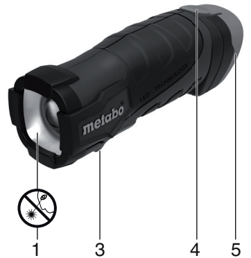
PowerMaxx TLA LED