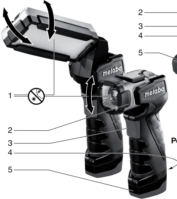
PowerMaxx SLA LED